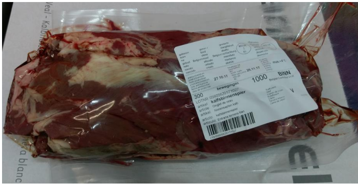
FOTO PRESENTATIE BAK