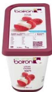
ref. DF226 Puree lychee 1 kg ***