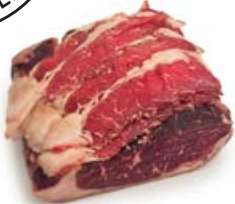
ref. CR1020 Alpenrind entrecote gepekeld / gezouten 1,5 à 3 kg