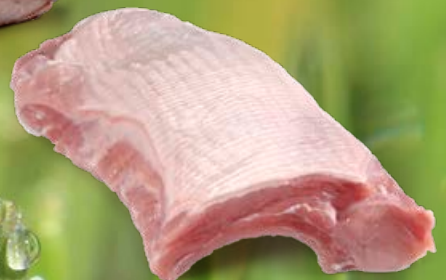
ref. V006 Speenvarkenracks licht gepekeld 1.8 kg

Aanbiedingen geldig van 01-05-2024 t.e.m. 31-05-2024