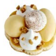
ref. DD4002 Lemon cloud 11 st x 102 g ***