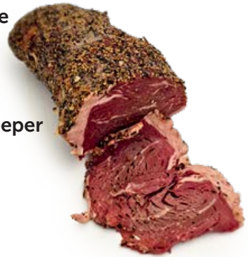
ref. CR1061 Pastrami peper 0.5 kg-1.5 kg