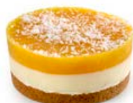
ref. DD527 Zandtaartje mango kokos tdp 16 st x 90 g ***