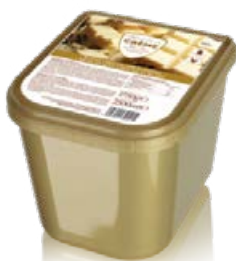
ref. DR103 Roomijs witte chocolade 2 st x 2,5 l ***