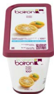
ref. DF263 Puree yuzu 1 kg ***