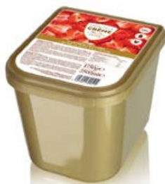
ref. DR104 Roomijs aardbei 2 st x 2,5 l ***