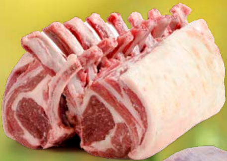
ref. L10120 Lamskroon Texel met vet 2 x 540 g