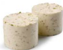
ref. DD1700 Ijsgekoelde nougat porties 30 st x 65 g ***