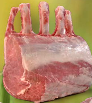
ref. V1060 Varkenskroon superdoux 1 kg