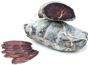
ref. CR1010 Alpenrind rump gezouten/gedroogd ± 1 kg