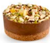
ref. DD5462 Zandtaartje van gianduja tdp 16 st x 90 g ***