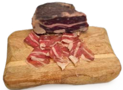
ref. CR1050 Mediterraanse brisket 0.5 kg-1.5 kg