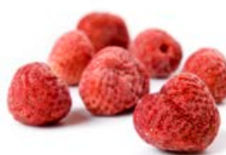
ref. DF107 Gehele aardbeien 1 kg ***