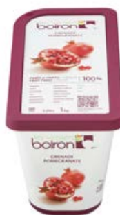
ref. DF254 Puree granaatappel 1 kg ***