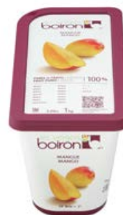
ref. DF211 Puree mango 1 kg ***