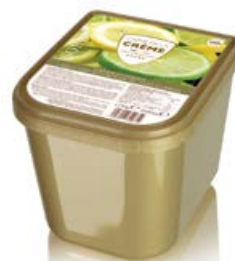
ref. DS100 Sorbet limoen 2 st x 2,5 l ***