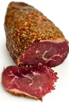
ref. CR1060 Pastrami Italian style 0.5 kg-1.5 kg