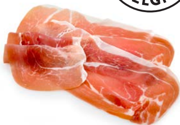
ref. C2021 Ganda voorgesneden 500 g