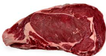
ref. R122013 Entrecôte Haspengouw beef 3 kg