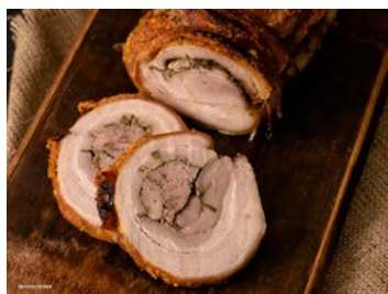
ref. V3510 Brasvar porchetta 5 kg