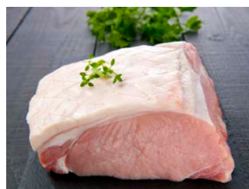
ref. V3501 Brasvar rugfilet zonder ketting 1,8 kg