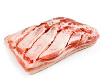
ref. V35020 Brasvar buik 2 af kant zonder zwaard zonder knars ± 2 kg