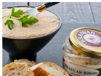
ref. V3558 Brasvar rilette 1,6 kg