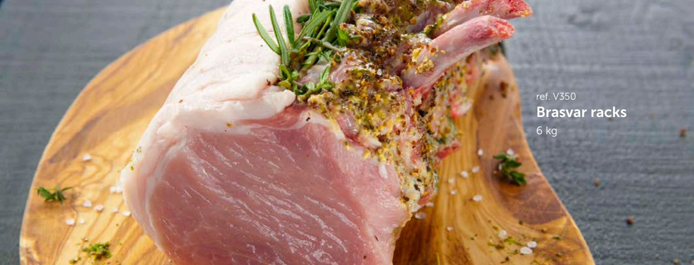
ref. V350 Brasvar racks 6 kg