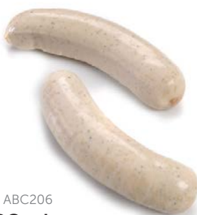
ref. ABC206 BBQ witte pens 6 x 100 g