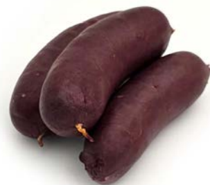
ref. ABC2076 Bloedworst 6 x 100 g