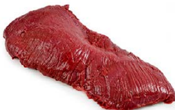
ref. AR8000 Randsbavette Aloyau Haspengouw beef