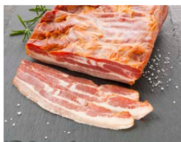
ref. V3515 Brasvar gerookt spek 2 kg