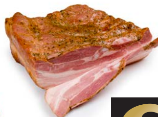
ref. C2190 Breydel / barbeque- spek 1,3 kg